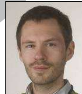
AMNESTY NORD ogs@amnesty.no