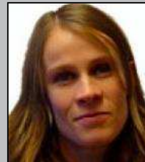
AMNESTY SØR candersson@amnesty.no