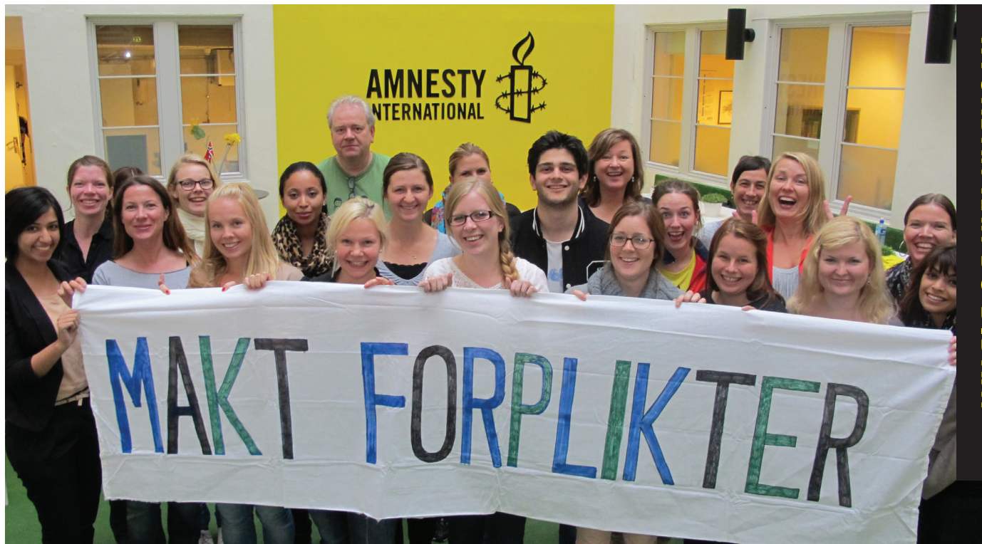
AKTIVISTER PÅ WORKSHOP.